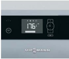
Regelung Ecotronic 100 mit beleuchtetem Display für einfache und intuitive Bedienung

Der Vitoligno 150-S ist ein kompakter, preisattraktiver Scheitholz-Vergaserkessel, der sich sowohl für den monovalenten als auch bivalenten Betrieb (Ergänzung zur Öl- und Gas-Heizungsanlagen) eignet.