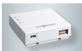
Vitoconnect 100 mit Anschlüssen für das Steckernetzteil (links) und zur Datenverbindung