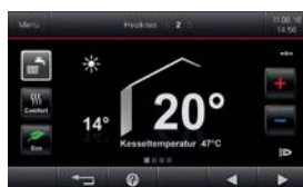
5-Zoll-Farb-Touch-Display der Regelung Vitotronic 200 (Typ HO2B)

* Voraussetzungen und Produktübersicht unter www.viessmann.de/garantie